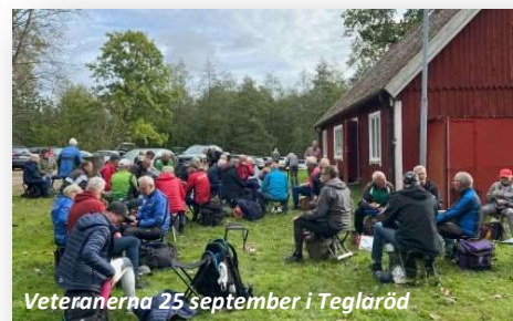
Veteranerna 25 september i Teglaröd