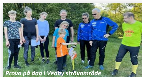
Prova på dag i Vedby strövområde