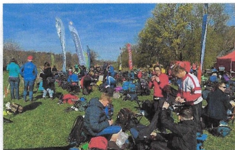
1 Bild från Kollebergamedeln den 29 april

Under året har klubben dessutom deltagit i Veteranorientering samt på OL-NV träningar.