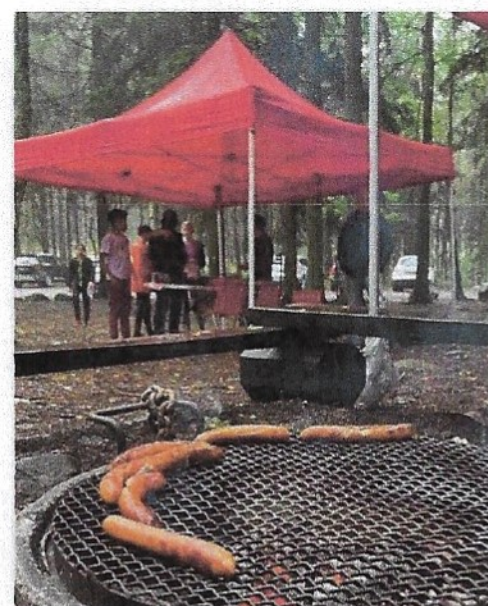
2 Prova på dag i Vedby strövområde